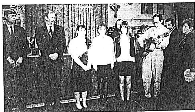
A Gróf Széchenyi István Általános Iskola tanulói énekkel köszöntik az avatón résztvevőket.