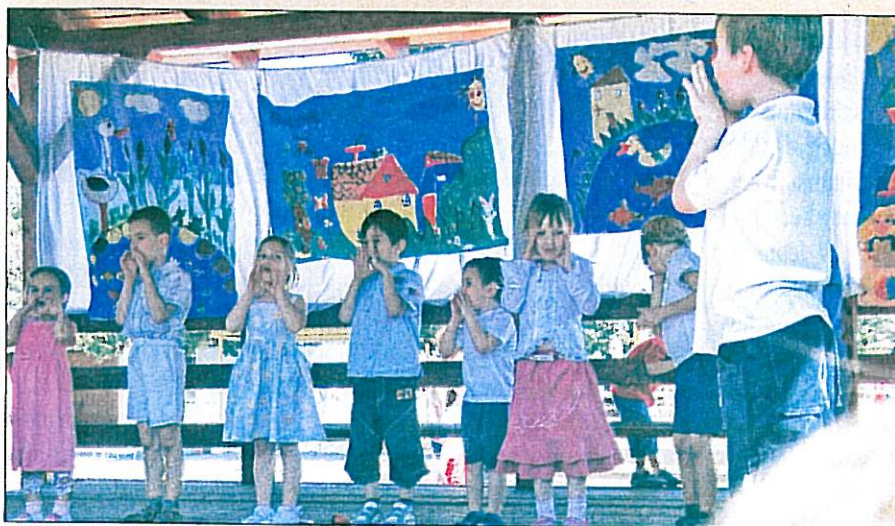
Családi nap az óvodában

Külön meglepetés volt, amikor a gróf Széchenyi Általános Iskola drámaszakköröseinek vegyes csoportja két előadással lepte meg az iskolába látogató óvodásokat: a tanulók Pogány Tibor és Lázár Ervin egy-egy művét mutatták be nagy sikerrel.